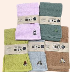
キャンプスタンドヒバカラー フェイスタオル

秋を素敵に彩ってくれる、おすすめタオルを集めてみました♪ この秋はぜひお気に入りの1枚と一緒に過ごしてみませんか？