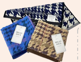
メロンドウ グレンチェック プチャタオル

TOWELS' WORD 【杻系 もくいど】 2色以上の糸を撚り合わせて 一本にした糸。単色とは違う、 色の深みを表現できます。