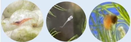
ごくひ 【極火エビ】 みゆき 【幹之メダカ】 【レッドラムズホーン】

食堂の水槽はまさにベビーラッシュです! 種別を超えて、 たくさんの赤ちゃんが 仲良く過ごしています。 これからの成長が楽しみです!